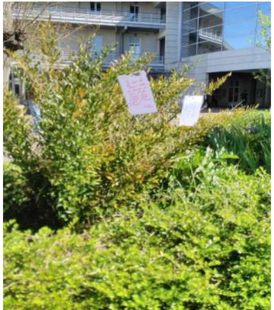
Photographie d'un arbre à rêves

Cette première édition des Rencontres d'Eugénie a permis à ceux qui le souhaitaient d'exprimer leur-s rêve-s ou de réfléchir aux utopies, sous différentes formes.