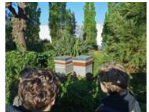
Photo des ruches des éco-délégué·e·s