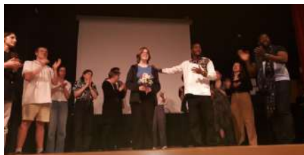
Photo du concours d'éloquence