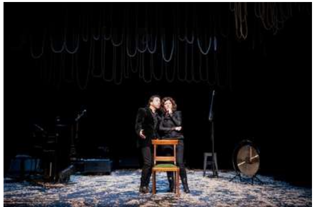
Photographie de la pièce Monte Cristo