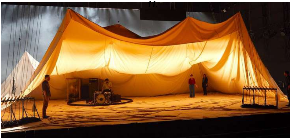
Picture of the stage of Dans la Mesure de l'Impossible